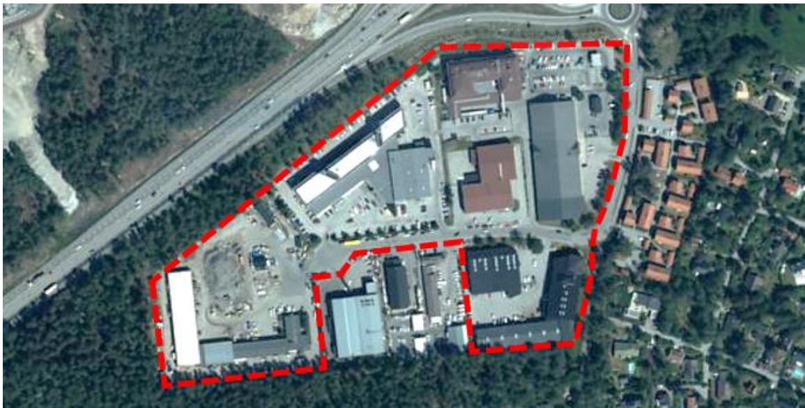
Figur 1 Översiktskarta med preliminärt planområde för Bergtorps verksamhetsområde.